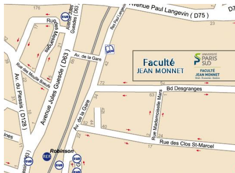
Plan de la Faculté Jean Monnet – Salle Vedel (bâtiment G)

RER B, Station Robinson, descendre l'avenue de la Gare, puis prendre à droite, boulevard Desgranges.