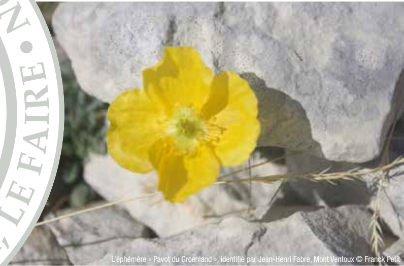
L'éphémère « Pavot du Groenland », identifié par Jean-Henri Fabre, Mont Ventoux

en association avec le Théâtre du Chêne Noir